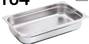
POJEMNIK GN 1/1, STANDARD