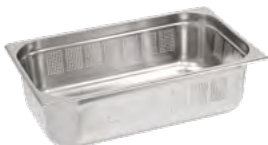
POJEMNIK PERFOROWANY GN 1/1, STANDARD