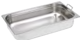
POJEMNIK GN 1/1, BASIC