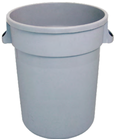
POJEMNIK NA ODPADY