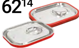
POKRYWA SZCZELNA, STANDARD