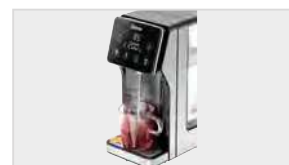
▶ Możliwość indywidualnego ustawienia ilości wody z dokładnością nastawy w zakresie od 100 do 400 ml