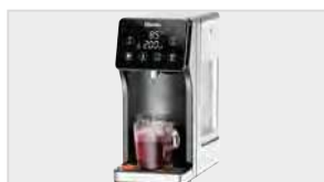
▶ Nowoczesny, atrakcyjny design