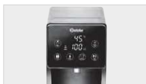
▶ Przycisk szybkiego wyboru „Pokarm dla niemowlaka” o temp. 40 °C ▶ Przycisk szybkiego wyboru „Kawa/herbata” o temp. 98 °C