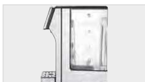
▶ Pojemność zbiornika: 3 litry